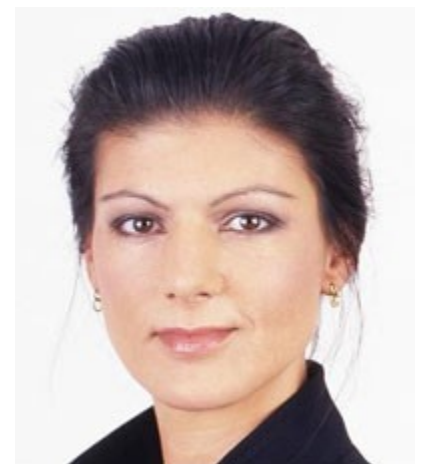
Sahra Wagenknecht, MdB, ist Wirtschaftspolitische Sprecherin der Fraktion DIE LINKE und stellv. Parteivorsitzende

Deshalb sind die Forderungen der LINKEN für einen echten Politikwechsel hin zu einer gerechten, solidarischen und zukunftsfähigen Gesellschaft so aktuell wie nie!